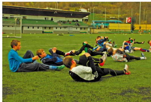
Počas tréningu pod vedením štyroch trénerov z akadémie MŠK Žilina.

Potom sme sa presunuli na štadión, kde sa už mal čochvíľa začať dlho očakávaný futbalový zápas Slovensko - Fínsko. Vidieť hrať naživo hráčov, ako Hamšík, Škrteľ a Kozáčik - o tom snívajú každý mladý začínajúci futbalista. Tento sen sa splnil aj našim žiakom. Povzbudzovali sme,