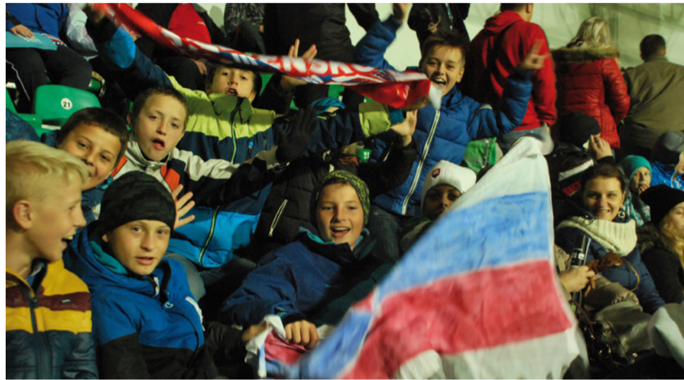
Slovenskóóó, znelo z hrdiel žiakov športových tried ZŠ Komenského nielen na štadióne v Žiline, ale ešte počas dopoludňajšieho vyučovania.

Veríme, že našich futbalistov aj takto motivujeme v ich začínajúcej futbalovej kariére a že podobných podujatí bude stále viac. ZŠ Komenského