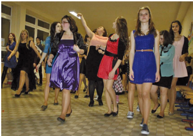
K plesu patria aj slávnostné róby, v ktorých boli deviatky skutočne krásne.

nám pomohli toto milé stretnutie zorganizovať. Veríme, že ples deviatakov sa stane