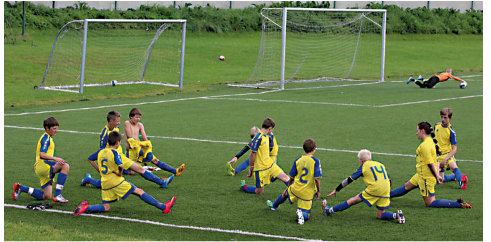
Ihrisko s umelou trávou v bieloaravskej metropole bude v úvodných mesiacoch nového roka opäť permanentne využívané.