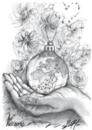
Ilustračná kresba: Anna Lajmonová ml.

Ale už som veľká. Už by som chcela byť Ježiško ja. Mala by som moc vyčariť najkrajšie Vianoce pre celý svet. Lebo už viem, že nie pre všetkých je vianočný čas