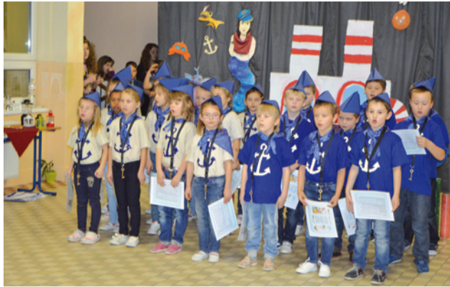
Prváčikovia sa spolu so staršími spolužiakmi s veľkým úspechom „plavili“ imatrikulačným programom a odmenou im bol potlesk i dojatia hostí.

Prvého decembra prváci zo Základnej školy na Komenského ulici v Námestove zažili slávnosť, kde im boli slávnostne odovzdané symbolické školské kľúče. Žiačikovia boli pasovaní do školského cechu terajšími deviatakmi. Pestrý program sa niesol v morskom duchu. Prváci, oblečení v milých námorníckych uniformách, „priplávali“ krásnou loďou. Svojou šikovnosťou a nadobudnutými vedomosťami hravo zvládli úlohy na Ostrove pirátov, roztancovali indiánsky kmeň a objavili poklad domorodcov zo Šťastného ostrova. S morským kapitánom ochutnali čarovný nápoj a naučili sa kormidlovať loď. Čas sa nedá zastaviť, rýchlo beží, dokázali to aj deti