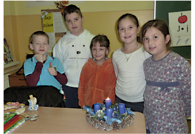
Adventné vence, spoločné dielo žiakov, rodičov a učiteľov.

Príprava na Vianoce v Cirkevnej základnej škole sv. Gorazda sa začala výrobou adventných vencov rodičov v spolupráci s triednymi učiteľmi a deťmi. Na prvej adventnej sv. omši všetky tieto venčeky kňaz požehnal. Modlitbou na začiatku a na konci vyučovania pri zapálenej svieci sme ďakovali a prosili o Božiu pomoc. V duchovnej obnove rodičia načerpali posilu pre tieto dni. Ôsmeho decembra bol prikázaný sviatok Nepoškvrneného počatia Panny Márie. Základom tohto dňa bola sv. omša, po ktorej nasledovala anglická a nemecká pieseň. V tomto roku to po prvýkrát bola súťaž, vystupovali žiaci z druhého stupňa. Nasledujúci deň začala aktivita Putovanie svätej rodiny. Obraz Svätej Rodiny putoval po rodinách deväť dní. Ráno pred vyučovaním bol program, pri ktorom si ho odovzdávalo vždy 17 žiakov (z každej triedy jeden). Takto mohlo aspoň symbolicky 153 rodín prijať