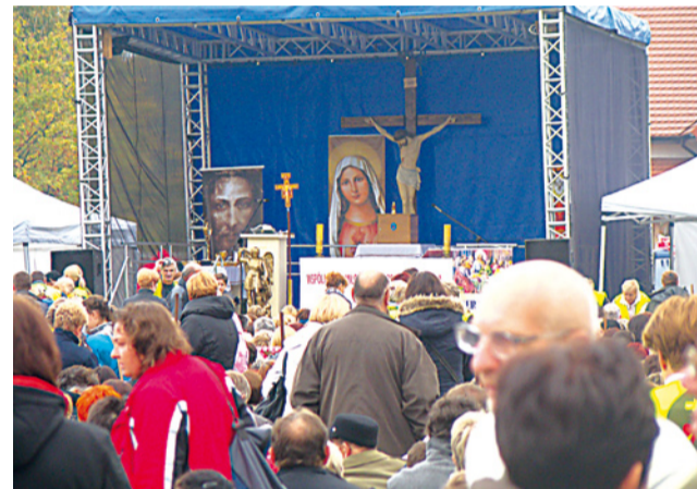
Atmosféra blízko oltára krátko pred začiatkom sv. omše a ďalších obradov v Czenstochovej.