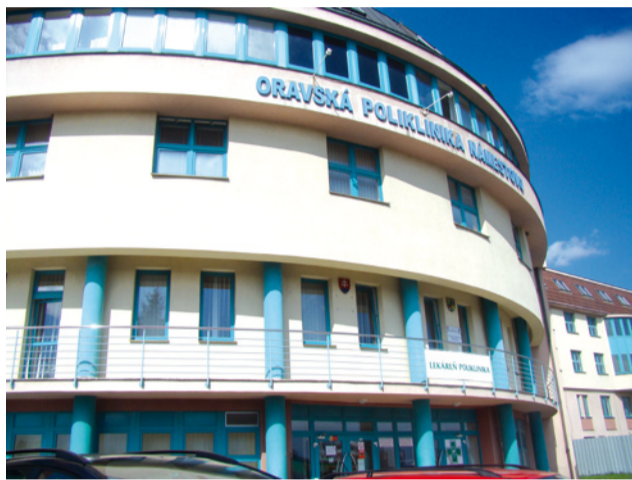
Ilustračné foto: (lá)

Integrované centrum je myšlienka ministerstva zdravotníctva a tento projekt je zatiaľ v procese, ešte sa stále tvorí. Ide o model podobný bývalým zdravotným strediskám, v ktorých sídlili všetci obvodní lekári – zubní, detskí lekári, gynekológovia... Práve títo lekári by mali byť súčasťou spomínaných integrovaných zdravotných centier. Uvažovalo sa v rámci centra aj o sociálnej sekcii, myslím si však, že pre náš región to nie