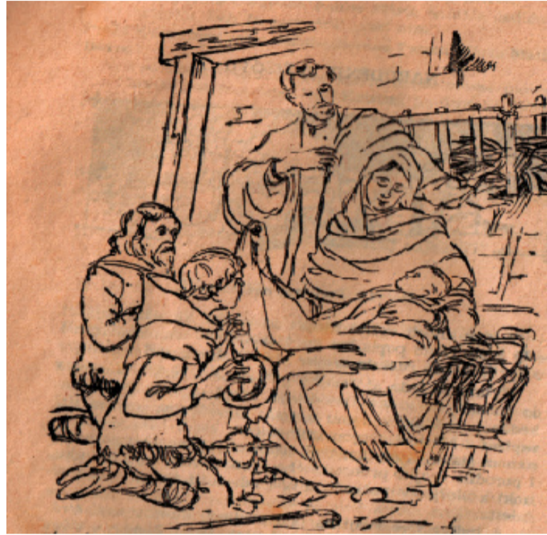
Ilustračné obr. z kalendárov do roku 1970