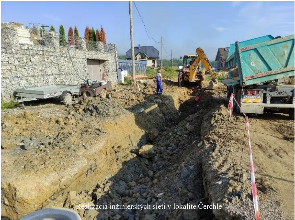
Realizácia inžinierských sietí v lokalite Čerchle