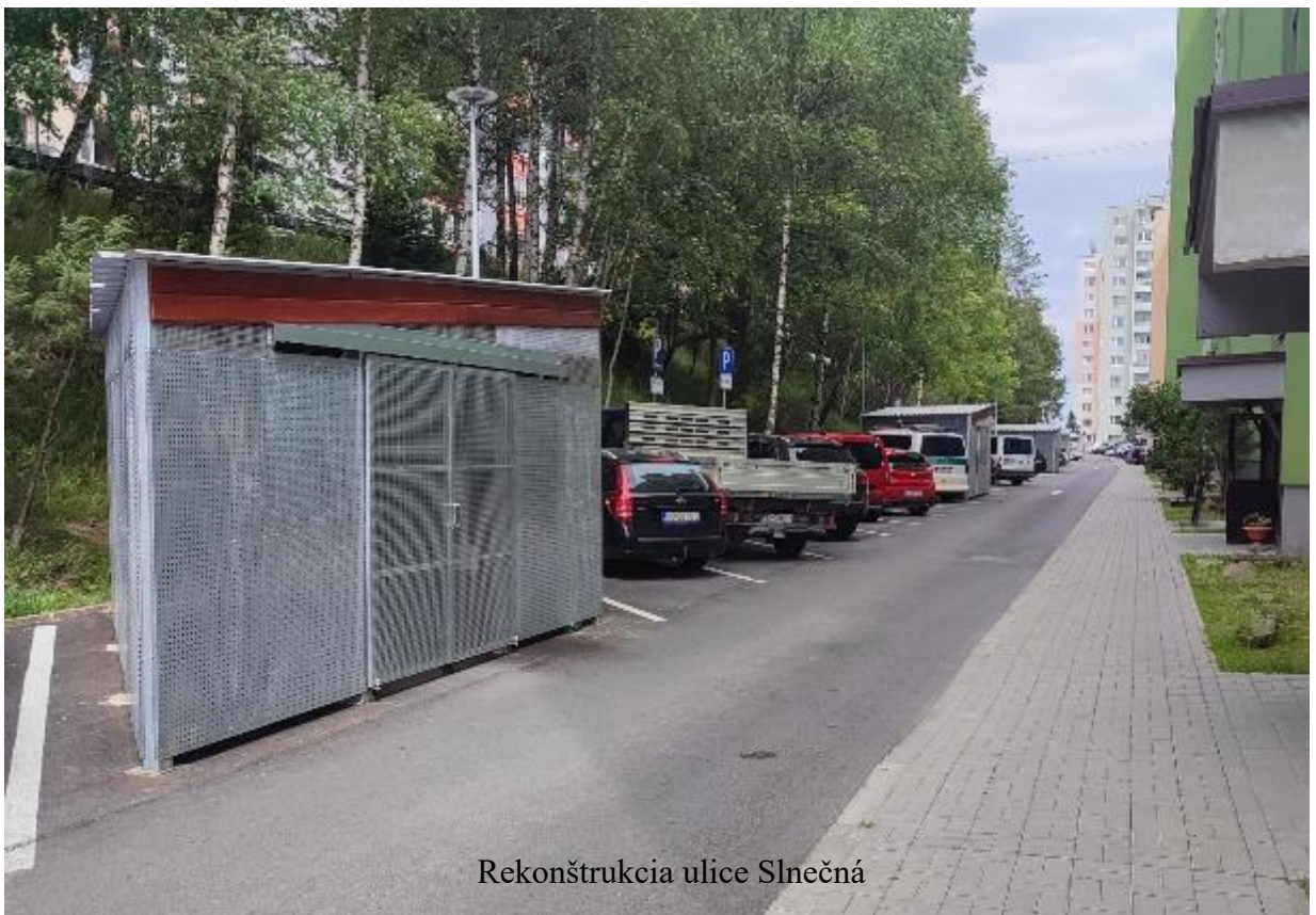
Rekonštrukcia ulice Slnecná