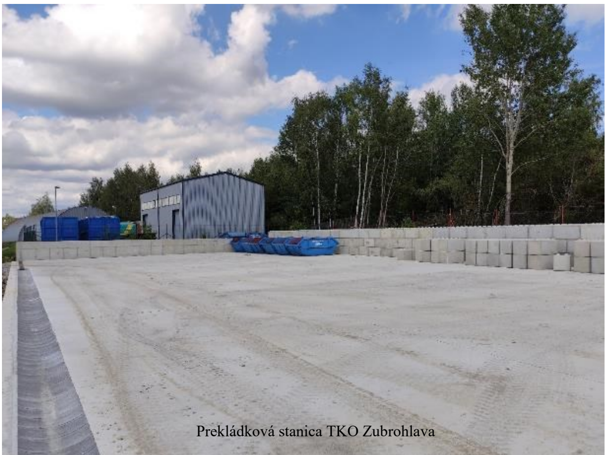
Prekládková stanica TKO Zubrohlava