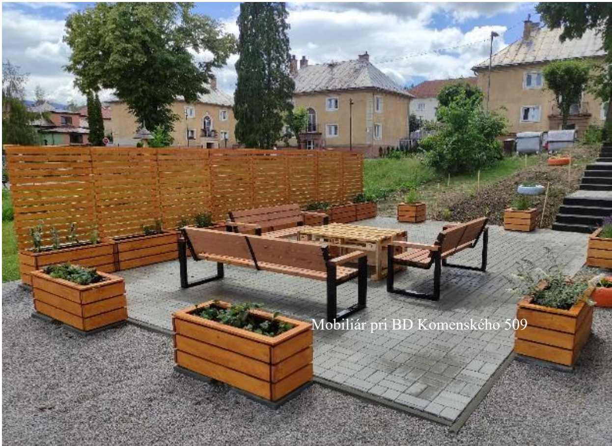
Mobilár pri BD Komenského 509