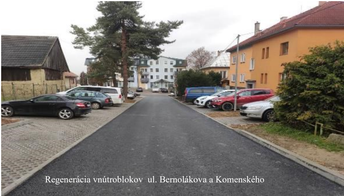
Regenerácia vnútroblokov ul. Bernolákova a Komenského