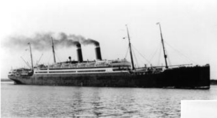
Parník „Amerika“ bol spustený na vodu v Belfaste v r. 1905. Viezol celkom 897 pasažierov, z toho 1. triedy 420, 2. triedy 254 a 3. triedy 223 pasažierov.

Gneisenau /1/, Caronia /1/, Oldenburg /1/, Oropesa /1/, Princess Matoika /1/, President Roosevelt /1/, Volendam /1/, Cassel /1/, Hercynia /1/.