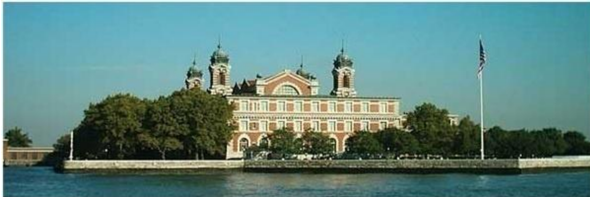
Budova Imigračného úradu dnes. V budove je múzeum prisťahovalctva „Ellis Island Immigration Museum“.

Po 15 až 60-tich dňoch – podľa rýchlosti plavby - pristála loď v prístave, pri móle East River v New Yorku. Vystáhalci 3. triedy boli prevezení člmi alebo trajektami na ostrov Ellis Island, kde sídlil Imigračný úrad a kde museli Námestovci prekonať poslednú prekážku na ceste za lepším životom.