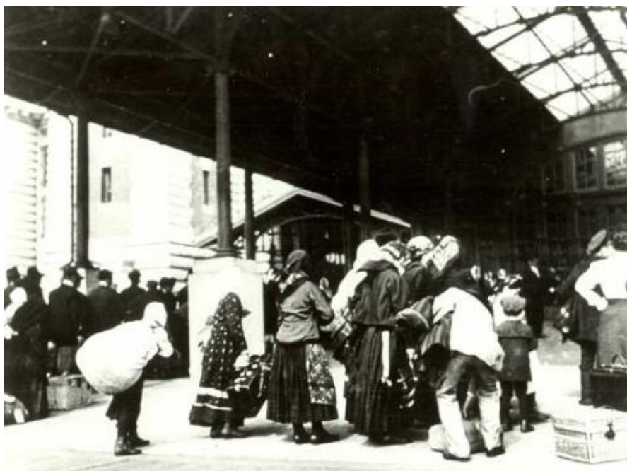
Príchod na Ellis Island

V rokoch 1820 – 1892 sídlil Imigračný úrad na juhu Manhattanu v prístave Castle Garden. Odtiaľ ho presťahovali na ostrov Ellis Island, kde v tieni Sochy Slobody postavili novú budovu z „Gruzínskej borovice“ a otvorený bol 1.1.1892. Tento ostrov sa premenil na malé mesto, v ktorom sa nachádzal nový Imigračný úrad, súd, škola, nemocnica, obchody a ubytovne. Večer 17. júna 1897 budova do základov vyhorela. Okamžite začali stavať novú „ohňovzdornú“ budovu otvorenú 17. decembra 1900 a v tento deň prijali 2 251 prisťahovalcov. Cez tento ostrov prešlo medzi rokmi 1892 až 1954 do Ameriky viac ako dvanásť miliónov (uvádza sa aj 17 miliónov) prisťahovalcov. V novembri 1954 bol Ellis Island oficiálne uzavretý. V r. 1965 vyhlásili Ellis Island za súčasť Sochy slobody, ktorá bola postavená na susednom ostrove, za Národný pamätník. Po dôkladnej rekonštrukcii otvorili ostrov pre verejnosť a v budove Imigračného úradu zriadili múzeum „Ellis Island Immigration Museum“. Múzeum prijalo takmer 2 milióny návštevníkov ročne.