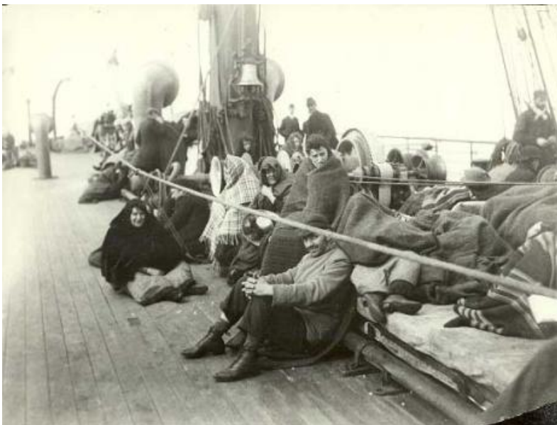
Vystáhovalci na lodi. Rok 1892.

Cestujúci 3. triedy boli umiestnení v podpalubí, v malých izbách ležali ľudia na regáloch na jednoduchom slamníku, spolu muži, ženy aj deti. Strava bola minimálna, väčšinou sa museli stravovať zo svojich zásob. Pitná voda sa rozdávala na prídel len v časových intervaloch, alebo len raz do dňa. Hygiena bola nedostatočná, vzduchu v izbe málo, mnohých premáhala morská nemoc.