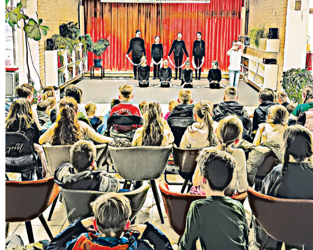
DSS Pierrotáčik zo SZUŠ Pierrot a ich tvorivo-divadelné pásmo pre deti.

Našou dlhodobou snahou je, aby bola knižnica živým