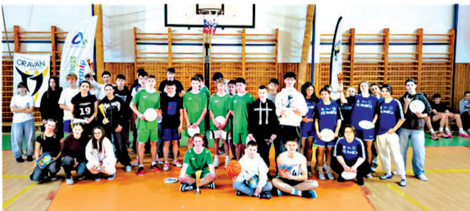
Účastníci Štefanského turnaja 2025 (kategória žiačky, žiaci).

trojnásobné zastúpenie na majstrovstvách Slovenska. Do zvyšnej časti sezóny držte našim hráčom palce, aby sa im podarilo vybojovať čo najviac úspechov, buď účasťou v 3. lige, alebo na majstrovstvách SR.