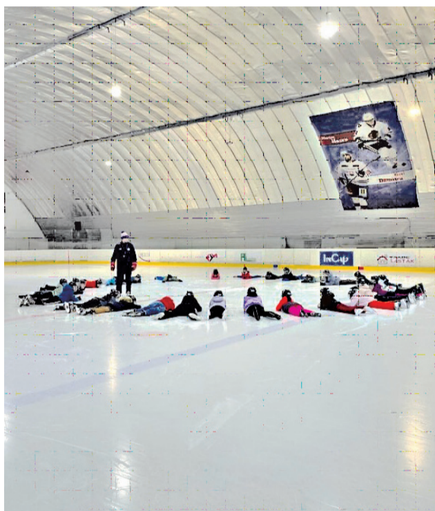
Korčuliarsky kurz 5. ročník.