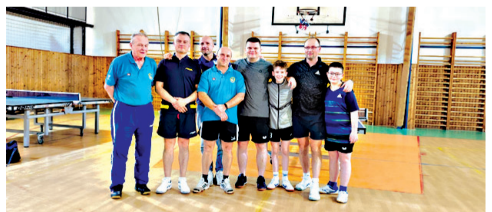
4. liga Námestovo A – Tvrdošín B.