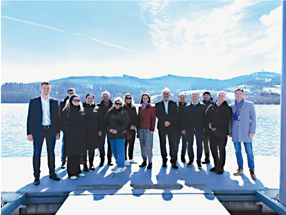
Starostovia na návšteve Námestova spolu s domácimi hosťami.