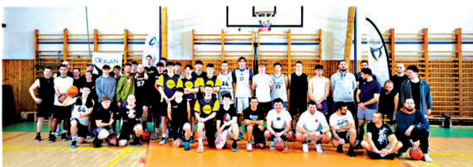
Účastníci Štefanského turnaja 2025 (kategória OPEN).