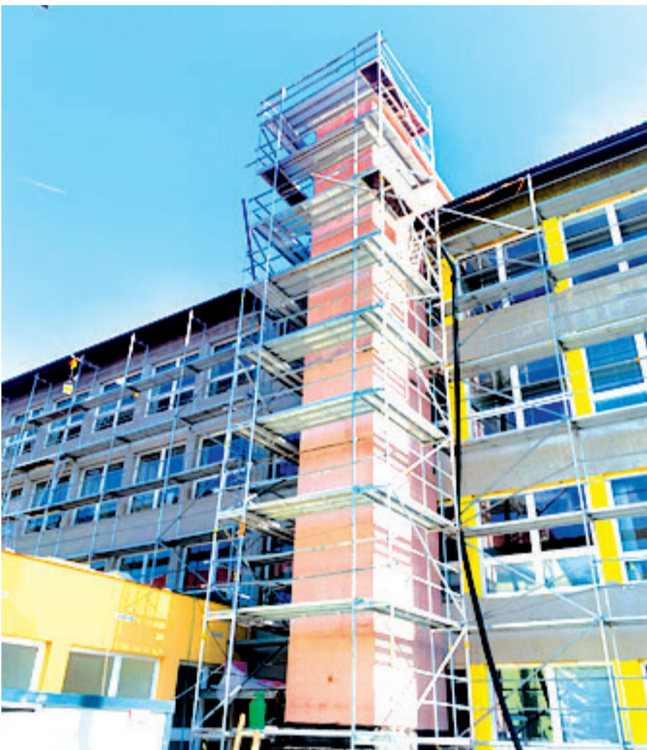
Pohľad na zateplovacie práce a budovanie výťahovej šachty.