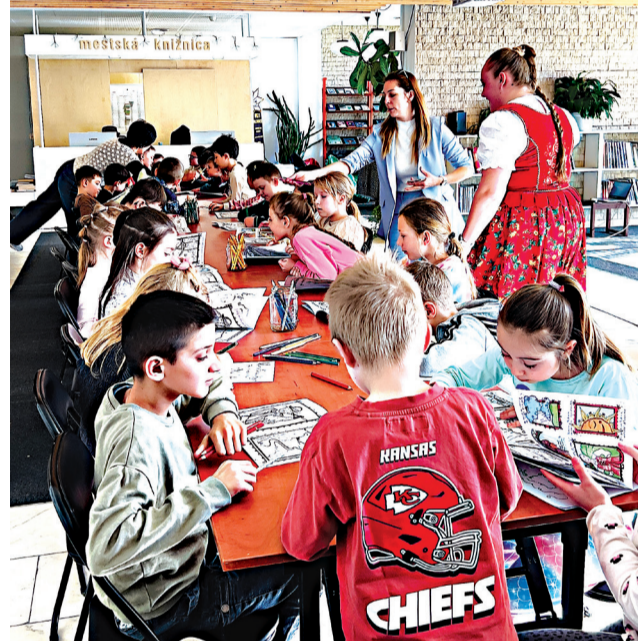
Naše pozvanie prijalo aj Európske centrum gajdošskej kultúry a pripravili sme tak workshop, prednášku, kvíz goralského nárečia či spev a omalovánky.

Teší nás, že knižnica otvára priestor aj pre témy, ktoré sa dotýkajú života v regióne, ako napríklad debata Na Orave dobre, na Orave bez spoja. Aktuálne do programu pribudla aj novootvorená výstava Hlbiny materstva II,