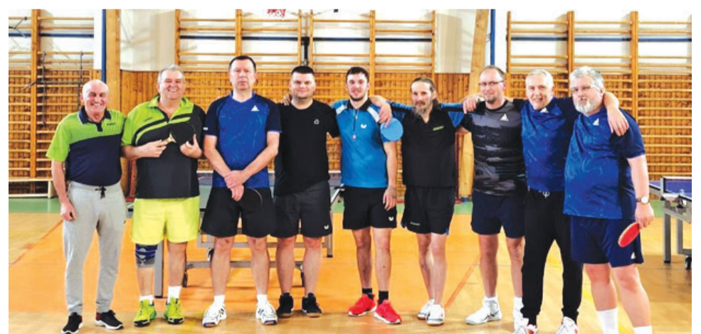
4. liga Námestovo A – Bziny A