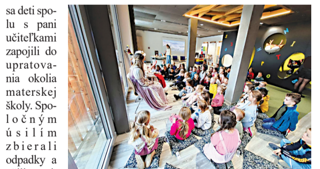
Čítanie s pánom kráľom.

Veľkým zážitkom bola aj Noc s Andersenom, ktorú absolvovali predškoláci zo Sovičkovej triedy. Deti strávili noc v materskej škole, kde ich čakal zaujímavý program plný rozprávok, hier a spoločných aktivít. Nechýbala ani obľúbená škôlkarská akcia Veľkonočný zajačík, ktorú pre celú materskú školu pripravila trieda Zajačikov. Pri príležitosti Dňa Zeme