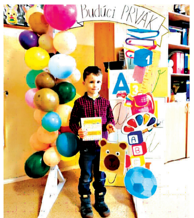
Zápis do 1. ročníka.