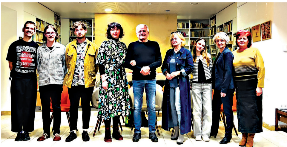
Aj tento rok sme boli súčasťou Je nás počuť!, ktoré propaguje literatúru, knihy i knižnice. Pozvanie prijali aktívni ľudia z mesta i okolia, ktorým kultúra nie je veru cudzia...

Dom kultúry v uplynulých mesiacoch pripravil pre verejnosť pestrú ponuku podujatí pre všetky vekové kategórie. Od februára sa tu uskutočnilo množstvo kultúrnych, spoločenských aj vzdelávacích aktivít.