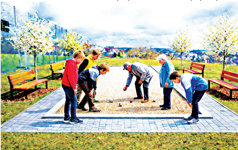
Petangové ihrisko vo vizualizácii.

petangového ihriska v areáli školy. Projekt sme podali do výzvy Ministerstva financií Slovenskej republiky a v sú-