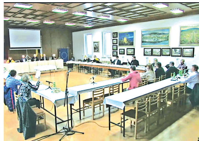
Pohľad do rokovacej sály.

Ďalšie dva body rokovania priamo súviseli s týmito predchádzajúcimi, pretože bolo potrebné upraviť rozpočet a schváliť nájom pozemku pod bežeckú dráhu a ostatné cvičiská. Pozemok totiž patrí MŠK. Športový klub pristúpil na podmien-