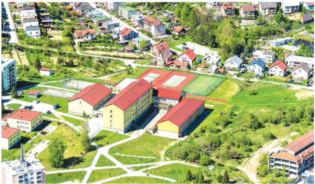
Ilustračná fotografia, ZŠ Slnecná.

Iná otázka je, kto bude tieto zariadenia prevádzkovať a za akých podmienok. Okrem mesta to môže byť cirkev, alebo aj iné, napríklad súkromné subjekty. Rozdiel však spočíva v tom, že kým cirkev a súkromníci tieto zariadenia pre-