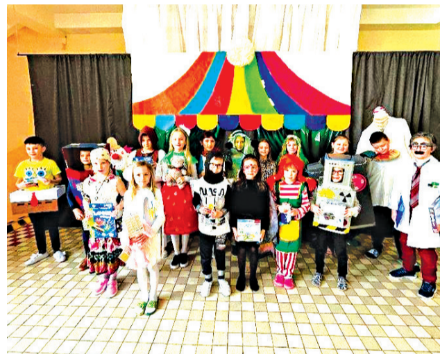
Karnevalové masky žiakov boli dokonalé.