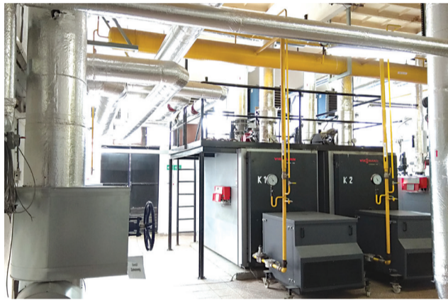
Moderná PK2 kotolňa Bytového podniku Námestovo.

rozdiel medzi najnižšou a najvyššou cenou ZP na úrovni 5,3 € za MWh, v roku 2021 to bolo 125 €/MWh a v roku 2022 dokonca až 270 €/MWh. V tomto chaotickom období sa veľmi zle orientuje a ešte horšie nakupuje. Nikto z nás nevie predvídať, ako sa budú ceny ďalej vyvíjať na svetových trhoch. Bytový podnik Námestovo potreboval aj v roku 2021 zrealizovať nákup ZP na obdobie nasledujúceho roka, preto sme sa touto otázkou nákupu intenzívne zaoberali veľmi dlhé obdobie počas roka a nakoniec sme prišli s alternatívou nákupu komodity ZP na dlhšie obdobie. Oslovili sme viac dodávateľov a dali si vypracovať cenové ponuky na