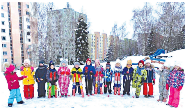
Malí lyžiari s úsmevom na tvári...