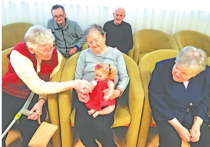
Túto terapeutickú bábiku dostali seniori na Vianoce od troch mladých ľudí.

Vždy sa nájdu aktívni seniori, ktorí napriek veku, chorobe alebo zdravotnému znevýhodneniu, dokážu vytvárať nejaké pekné veci, alebo nás udivujú svojim optimizmom. U mnohých ľudí som videla