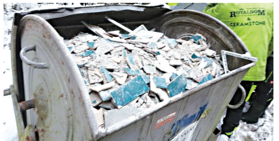
Zberné vozidlo takýto kontajner so stavebným odpadom nezodvihne.