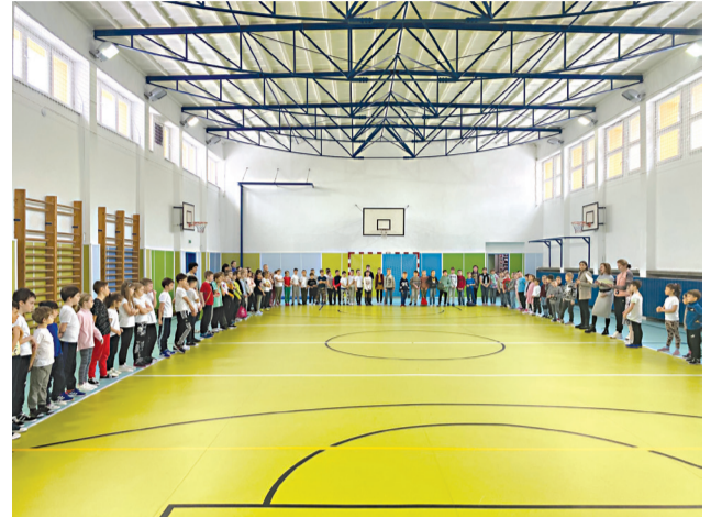
Vzťah sa dá vyjadriť aj cez vybíjanú.

ky žiakom pripravili krásne dopoludnie v duchu karnevalového sprievodu. Už od skorého rána sa naši najmenší prechádzali po škole