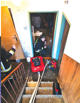
V bytovke na Bernolákovej ulici...

ky prenájmu a sám navrhol rok predniesla hlavná kontrolórka, čo poslanci zobrali na vedomie.