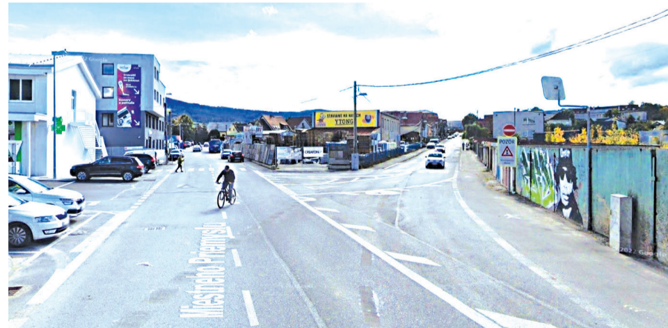
Križovatka ulíc Miestneho priemyslu a Hattalova.