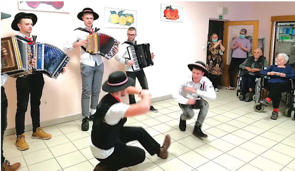
Mladí muzikanti zo SOŠ technickej v Námestove pripravili klientom domova veselé fašiangy.

V tomto máme, spoločnosť aj rodina, naozaj taký dlh a stále tú chybu opakujeme. Nedokážeme tieto hodnoty využívať. Treba si na našich blízkych nájsť čas. A čas je asi ten problém, resp. ochota nájsť si čas v tú správnu dobu je problém. Pretože treba to ešte dovtedy, kým sa náš blízký fyzicky i psychicky cíti dobre, kým nemá nepohodu z choroby. Bolo by to treba ešte v čase, kým seniori ešte stoja o túto blízkosť. Kým