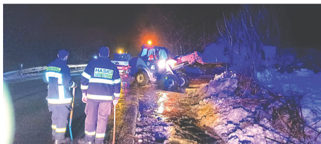
Dobrovoľní hasiči zasahovali aj v noci – na štátnej ceste pod Svätým Jánom.