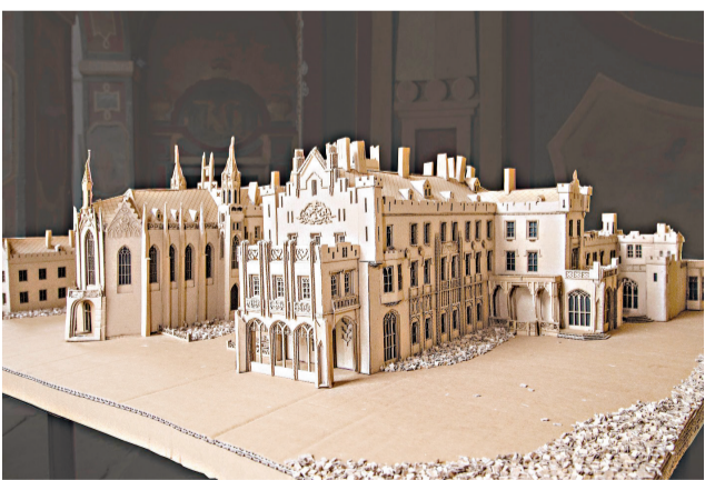
Jedna z víťazných prác z minulých ročníkov.

Stredná odborná škola technická v Námestove sa zapojila do zaujímavej výzvy – medzinárodnej súťaže o najlepšiu stavbu z vlnitej lepenky. HSF System Modelium 2023 prináša už 15. rok príležitosť pre študentov zmerať si sily a tvorivé schopnosti, tentokrát pri tvor-