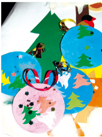
Gule. CVČ Maják