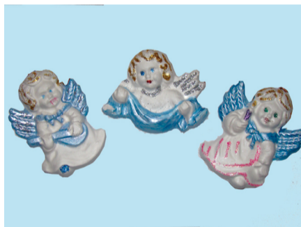
Aj anjelikov zo sadry vyrábali deti z tvorivých dielní v CVČ Maják.

Balík peňazí od darcov sa pomerne rýchlo zvyšoval, pretože sa zväčšovala komunita ľudí, ktorú s organizátormi Námestovského anjela spájala myšlienka pomoci. Koncom roka 2010 už tento neziskový fond prijal pod svoje krídla pomoci štvrtú rodinu.