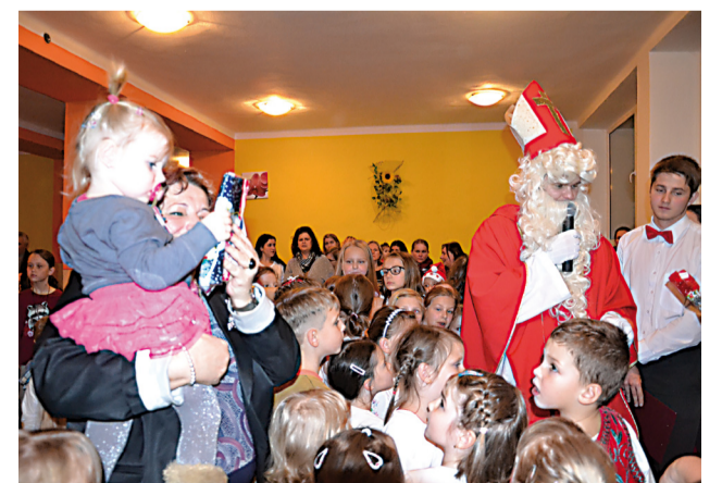
Mikuláš a prevkapania v troch orieškoch boli pre prítomných zaiste pekným darčekom.