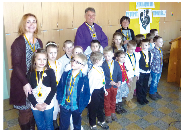
Na Mikuláša boli najmladší žiaci školy pasovaní na poriadnych školákov.

Na duchovnej obnove s názvom Rodinno-spoločenské agapé nebol len duchovný, ale aj spoločenský prog-