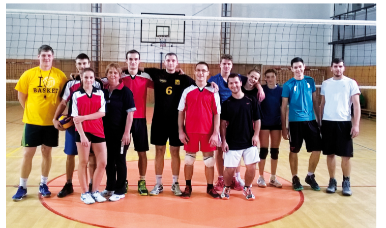
Účastníci Mestskej volejbalovej ligy 2015 - družstvá Tactic a Novotí.

Za organizačný výbor VúML a volejbalový oddiel Marián Melišík