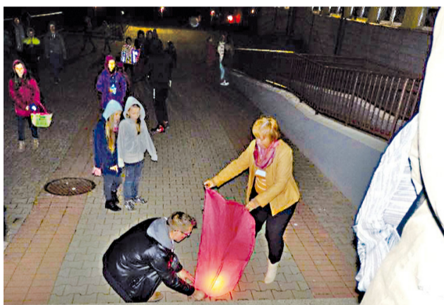
Lietajúce lampióny robili problémy, no nakoniec urobili radosť.