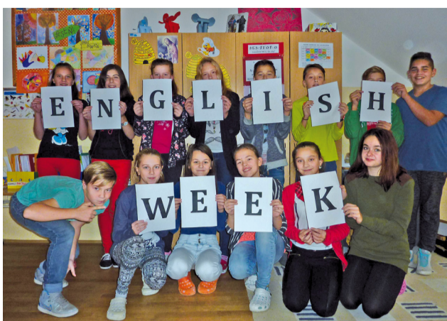
Žiaci 7. B triedy, vďaka ktorým vznikla myšlienka zrealizovať Anglický týždeň.

Anglický týždeň prebiehal veľmi zaujímavou. Na začiatku bola komunikácia medzi učiteľom a žiakmi trochu rozpačitá, ale potom, čo si žiaci osvojili nové frázy, sa začala praktická výučba anglického jazyka. A to je na jazyku to podstatné – vedieť ho použiť v bežnom živote. Dostali sme sa do nejednej komickéj situácie, kde sme potrebovali