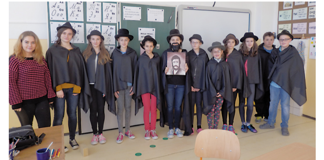
„Národ bez historickej vedomosti o sebe a predkoch svojich, je hromádka koží otrockých.“ Pamätajme si odkaz, myšlienky a ciele Ľ. Štúra nielen v dňoch významných výročí, ale neustále.

deti je nevyhnutné neustále im predkladať príklady a vzory týchto ľudí. Touto cestou môžeme deťom vstúpiť skutočné hodnoty, aby pochopili, že každému úspechu v živote by mala predchádzať usilovná a húževnatá práca, vzdelanie, elán a entuziazmus. Práve v dnešnej spoločnosti, ktorá je naplnená narastajúcim množstvom bezduchých celebrit z rôznych tv reality šou, je nevyhnutné, aby sa škola stala