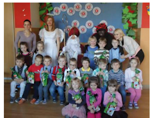
Škôlkari jednej z tried s Mikulášom a čertíkom.

ne, veršiky odmenil deti balíčkami. Pred odchodom zažalal Mikuláš deťom všetko najlepšie a ony mu na oplátku sľúbili, že budú celý rok dobré, budú poslúchať svojich rodičov a pani učiteľky. Prajú si, aby sa k nim o rok opäť vrátil. Na záver patrí veľké poďa-