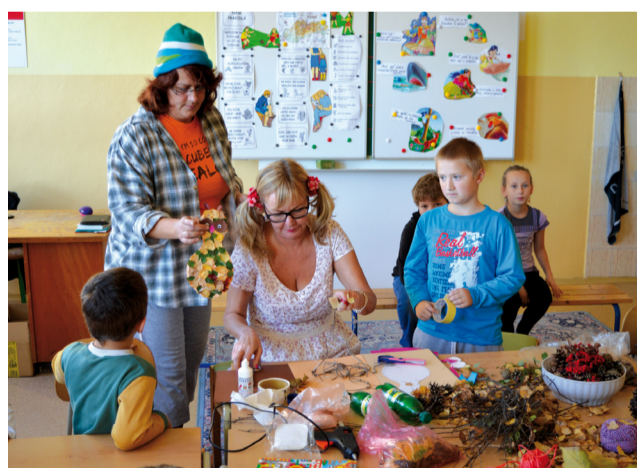
V tvorivej atmosfére.