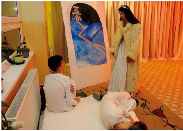
Pútavá scéna zo Snehovej kráľovnej sa určite škôlkárom páčila. Ako v naozajstnej rozprávke...

Kráľovstvo snehu charakterizovali slovami: krutosť - zlo - zima. Na svete by mala vládnuť láska, dobrota, priateľstvo, povedala v závere Gerda. Slová, ktorými by sa mali riadiť ľudia na celom svete, nakoniec roztopili ľad v kráľovstve a Gerde sa podarilo Kaya zachrániť.