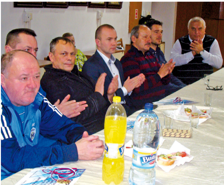
Ocenení i funkcionári – osobnosť pri osobnosti námestovského športu.