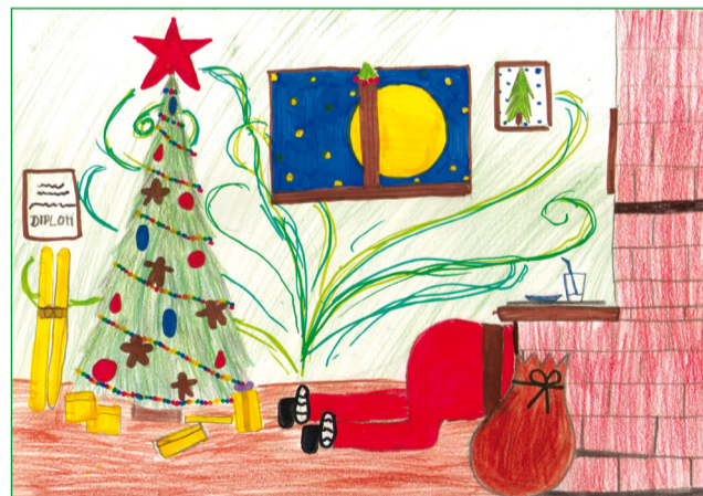
Eva Vrábová 3. A, zšk