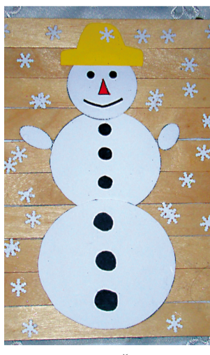
Snehuliak. CVČ Maják