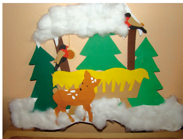
Jasle. Deti z CVČ Maják