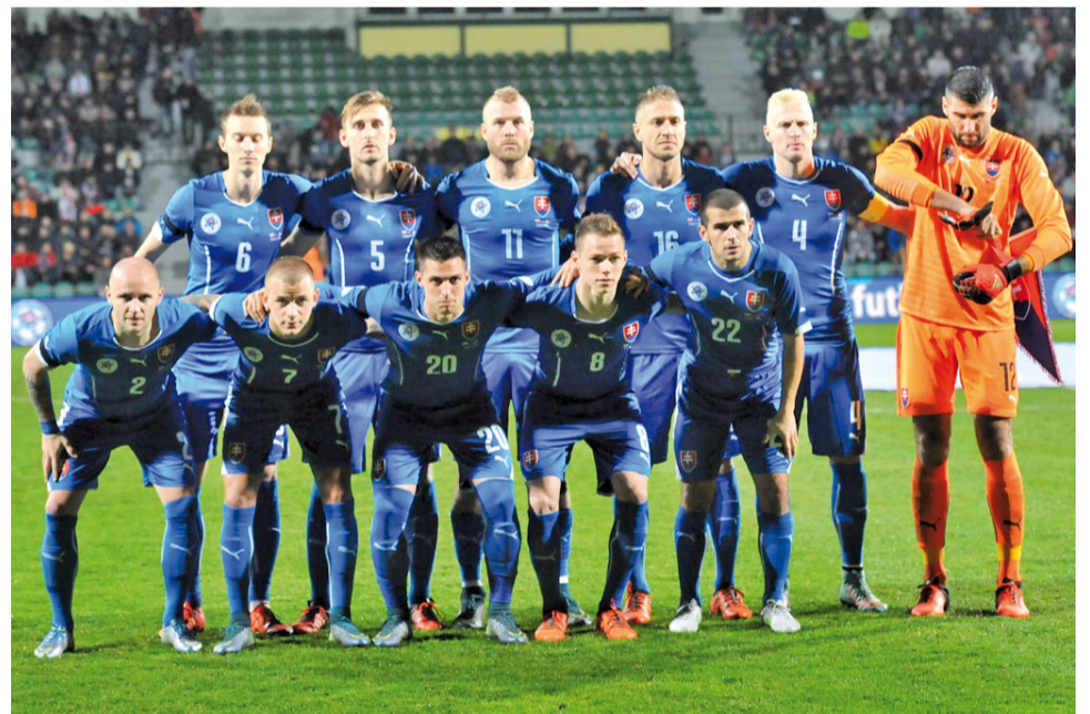
Slovenská reprezentácia porazila v Žiline v novembrovom prípravnom zápase Island 3:1 a žiaci športových tried ZŠ Komenského boli pri tom.

Na záver pri slovenskej hymne všetci s hrdoťou vstali a spievali. Iste nejednému napadla myšlienka, že