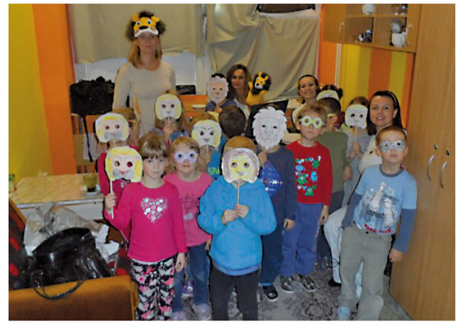
Vyšetrenie zraku je pre zdravie škôlkarov veľmi dôležité a zvolenou formou bolo aj zábavné.

Vyšetrenie špeciálnym prístrojom je bezdotykové, dieťa pri ňom sedí. Meranie oboch očí naraz sa robí zo vzdialenosti jedného metra, trvá len niekoľko sekúnd a nemá žiadne vedľajšie účinky. Keďže deti v predškolskom veku nevedia, čo znamená normálne vidieť, podvedome si hľadajú rôzne kompenzačné techniky, ktoré im pomáhajú. V takýchto prípadoch ani rodičia nemusia rozpoznať začínajúce sa zrakové problémy, či vedieť o dedičných predpokladoch na rozvoj očných porúch. Tie sa zväčša prejavujú až pri negatívnych študijných výsledkoch. Následným odborným vyšetrením u detského oftalmológa sa ukáže, či skutočne ide o začínajúce poškodenie zraku. Jeho zacytením v predškols-