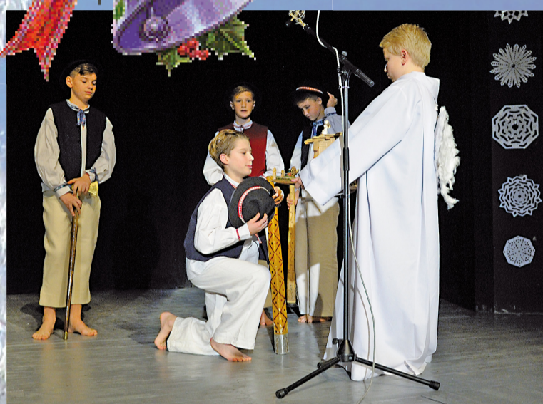
Betlehemci v podaní futbalistov zo 7. C zaspievali Jezuliatku i účastníkom nedávnej vianočnej akadémie ZŠ na Komenského ulici a koledami i vianočnými vlnami vniesli do sály domu kultúry čarovnú vianočnú náladu.

Musíme sa mať na pozore, aby sme podobnú chybu neurobili aj my. Aby sme nevyľúčili zo svojho života toho, ktorý chce urobiť náš život plným, bohatším a zaujímavejším, aj keď možno náročnejším. Anjel hovorí pastierom: