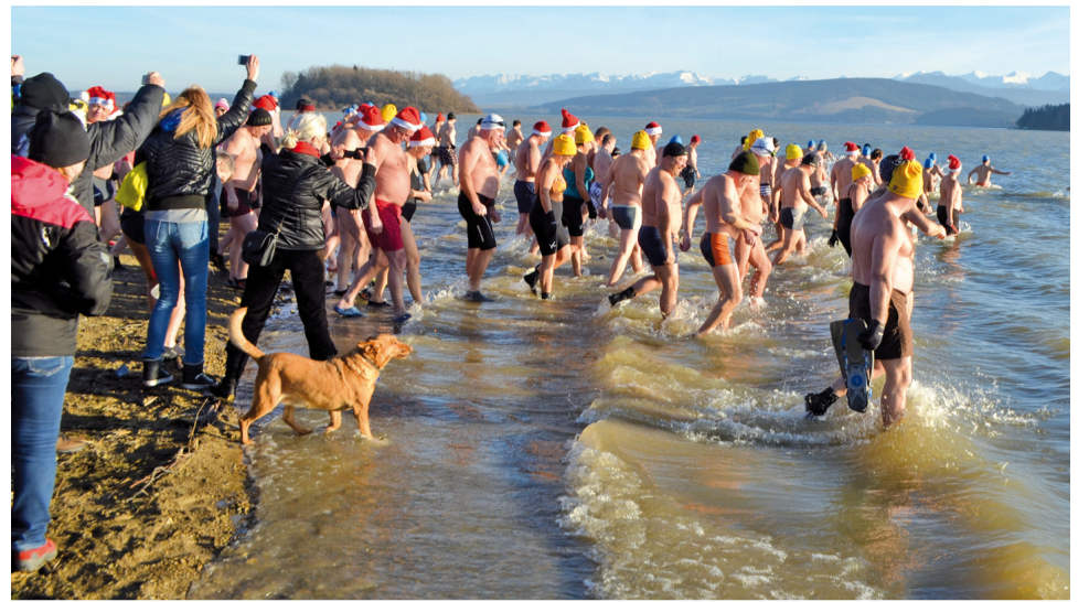
Do ľadovej vody sa vchádza ľahšie s kolektívom ako samému.

do roku 1993. Podujatím sme tiež chceli vzdať hold ľuďom práce, ktorí vytvárajú hodnoty za akýchkoľvek poveternostných podmienok, nepriazne či priazne počasia. Dúfam, že to nebolo verej-