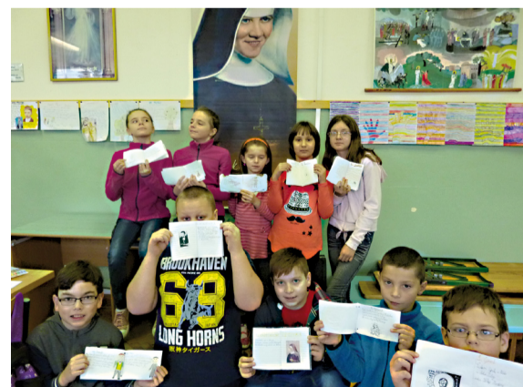
Žiaci prezentujú svoje diela – knižočky o svätých, ktorých život si museli najskôr dôsledne naštudovať.

Žiaci sa dozvedeli o živote sv. Gorazda, sv. Don Bosca, sv. Dominika Sávia, o sv. Laure Vicune, sv. Martinovi, sv. Faustine, sv. Anne, sv. Barbore, sv. Jozefovi, sv. Petrovi, sv. Kataríne, sv. Bakhite, sv. Terezii Veľkej, bl. sr. Zdenke, sv. Anne, sv. Alžbete, sv. Kláre... Najradšej žiaci robili záver – tvorba