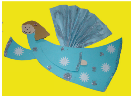
Kresba anjela od detí z CVČ Maják

„Ľudia predovšetkým netúžia po tom, aby im niekto ľutoval. Keď im nesiete pomoc, sú z toho zaskočení, zahriaknutí. V prvom momente začínajú uvažovať tak, že či sú už naozaj takí biedni, že im niekto chce pomáhať... Často povedia, že sami by veľmi radi stáli na strane tých, čo pomáhajú. Po rozhovore pochopia, že určite bude trochu ľahšie, ak prijímú pomoc - pre deti na úhradu školských poplatkov, ako príspevok na lieky, či na základné potreby, ktoré sa pre ich rodinu už vlastne stali luxusom. Aj tým chceme povedať, že ľudia sú ochotní bojovať so svojim trápením a nedostatkom, nie naučení vystierať ruku pre pomoc. Pomoc v tých rodinách je však určite namieste. Zo spomínaných 29 eur spomínaná mama hneď vedela, čo nutné deťom za tie peniaze kúpi.“